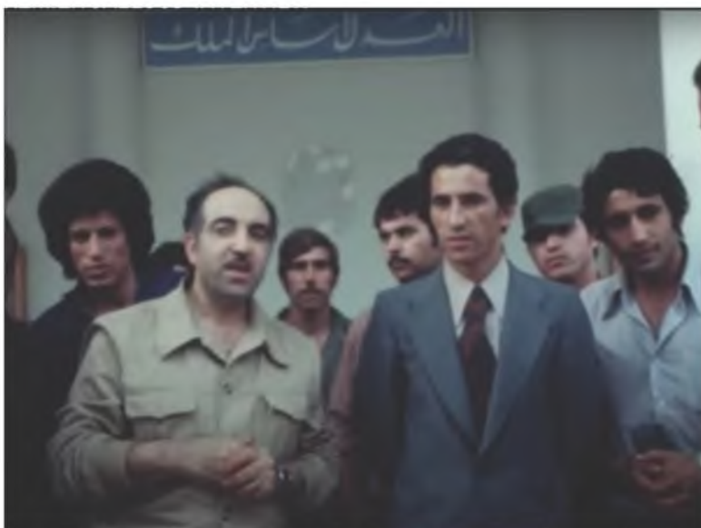
عبد السلام جلود أمام المحكمة العسكرية في لبنان إبان الحرب الأهلية، لبنان، 1976 / 6 / 15.